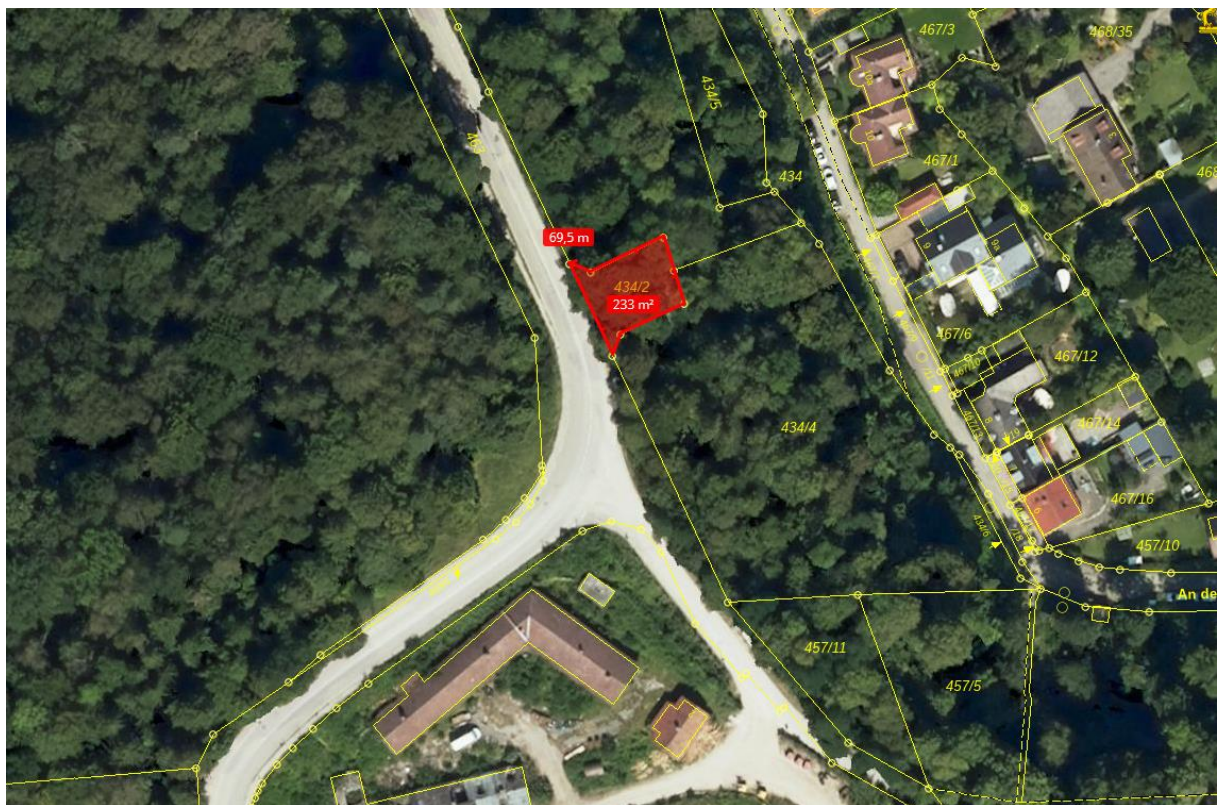
Abb. 1: Alternatives gemeindliches Flurstück Nr. 434/2 – fachliche Bewertung durch das AELF: geringere Eignung im Vergleich zum Vorhabensstandort

Auch private Grundstücke, darunter das ehemalige Staatsbahnhofs-gelände, sowie kommunale Flächen, insbesondere die Fl.-Nr. 434/2 an der Großhesseloher Straße (s. Abb. 1) und das Betriebsgelände der IEP GmbH (Energiezentrale), wurden geprüft, jedoch von den Fachbehörden und Netzplanern (AELF, Landratsamt München, DFMG) als funkttechnisch und/oder waldschutzfachlich deutlich ungünstiger bewertet bzw. standen nicht zur Verfügung.