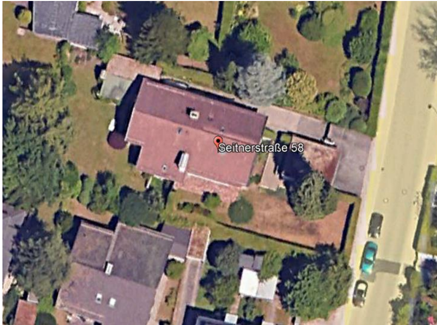
Abb. 1: Grundstück mit erkennbarer Serbischen Fichte

Die baumschutzfachlichen Entscheidungen beruhen auf den Festsetzungen im Bebauungsplan Nr. 15 „Gartenstadt“, der Verordnung der Gemeinde Pullach i. Isartal über den Schutz des Bestandes an Bäumen (BaumSchV), dem § 178 BauGB und § 9 Abs. 1 Nr. 25 BauGB: